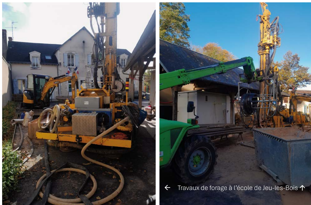
← Travaux de forage à l'école de Jeu-les-Bois ↑

Christophe AUFRERE Email : direction@payscastelroussin.fr Téléphone : 02 34 68 04 67